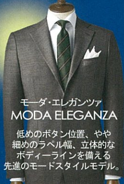
モーダ・エレガンツァ MODA ELEGANZA

現代ビジネスマンのための年齢を問わずお召しいただけるバランスの良いベーシックスタンダードモデル。