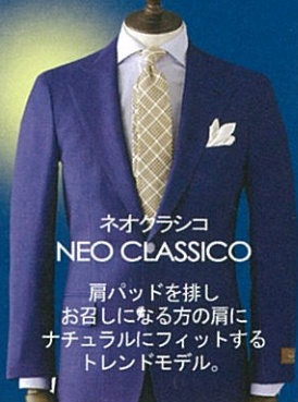
ネオクラシコ NEO CLASSICO

基本となるモデル一例：ネオクラシコ/コンフォートエレガンス/モーダエレガンツァ。シングルダブル合わせなどのディテールを細部にわたり決定してゆきます。服地とのマッチングが最適なボタンや裏地などのオプションをセレクトいただけるのもオーダーの醍醐味です。