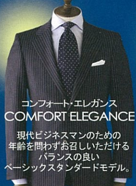
コンフォート・エレガンス COMFORT ELEGANCE

現代ビジネスマンのための年齢を問わずお召しいただけるバランスの良いベーシックスタンダードモデル。